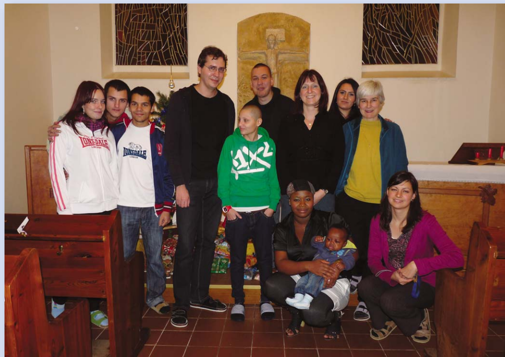
Společné foto před rozbalováním dárků