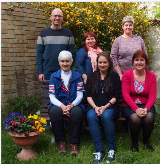
Pracovní tým Majáku